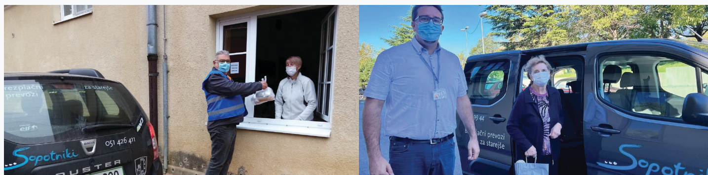
11-12. Fotó: Sopotniki önkéntesei munka közben a világjárvány alatt

A non-profit szervezeteken kívül az önkormányzatok is jelentős szerepet játszottak abban, hogy Szlovénia polgárai megőrizték az ellenállóképességüket. Ajdovščina községben (ami egy 20 000 lakosú terület az olasz határ közelében) háttértől függetlenül mindenkit sokként ért a vírus megjelenése 2020 elején. Rendkívül gyorsan kellett alkalmazkodni a megváltozott helyzethez. Kezdetben külföldről érkezett segítség köszönhetően Ajdovščina szoros kapcsolatának és a szolidaritásnak más európai uniós közösségekkel. Az első arcmaszkokat Olaszországból szerezték be. A világjárvány előrehaladtával egyre nehezebb lett a védőeszközök beszerzése, így Ajdovščina Polgári Védelmi Szervezete a kezébe vette a kezdeményezést és helyi vállalkozókkal összefogva saját védőeszközöket (ellátókészletek, védőfelszerelések stb.) kezdett gyártani. Mosható és újrahasznosítható maszkokat is gyártottak WaM1 márkánévvel (Wajdušna Metropola 1, n.d.t: Ajdovščina Metropoli 1), amiket kiosztottak a lakosság körében. A maszkokon kívül egy alkoholleperlő üzemet is létrehoztak, hogy saját fertőtlenítőszeret készítsenek, amit a Szlovén Köztársaság is elfogadott.