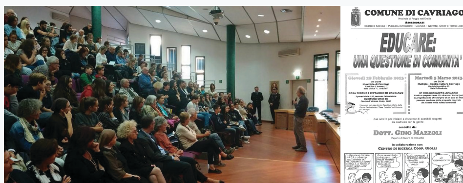
24-25. Kép - Educare projekt (balról jobbra): Helyi összejevetel, ahol a lakosok az Educare keretében gyűltek össze (pandémia előtti időszak); poszter, amivel ösztönözték a polgárokat, hogy vegyenek részt a találkozókön és osszák meg a véleményüket

A fiatalokat érintő kérdéseken kívül Caviagonak más területeken is változtatnia kellett, hogy megfeleljen a polgárok igényeinek. A pandémia előtt Caviago vezette az “Educare: A közösség kérdése” projektet, ami nyílt fórumként szolgált a polgárok (oktatók, helyi hatóságok, a civil szféra képviselői, önkéntesek stb.) számára, hogy új ötleteket javasoljanak, megosszák a nézőpontjukat és megoldásokat vitassanak meg a közösséget érintő kérdésekben. Alkalmazkodva a helyzethez, a világjárvány idején az Educare fórumot online formában tartották, így a polgárok véleménye továbbra is eljutott az önkormányzathoz és az éves rendezvényeket is a COVID-19 új valóságához lehetett igazítani. Az eredmények között szerepel az éves közösségi fesztivál átalakítása a pandémiás körülményeknek megfelelően, a színház és a bohócok világát bemutató műhelyek gyerekeknek, a szociális szolgáltatásokhoz való jobb hozzáférés biztosítása a fiataloknak, valamint egy női támogató csoport létrehozása (a bántalmazás feldolgozására és az önbecsülés fejlesztésére fókuszálva) helyi pszichológusok vezetésével. Caviago felismerte, hogy a fejlődés polgárokra összpontosító megközelítésével a különböző csoportok igényeire reagáló és hosszú távú előnyökkel járó módon lehet megoldani a problémákat.