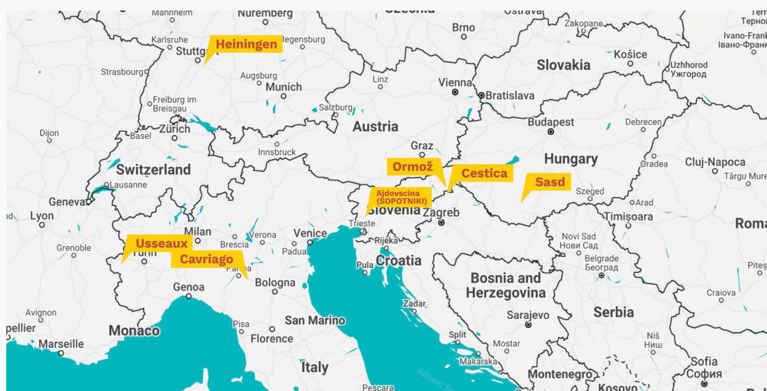
1.térkép A BEYOND projekt partnereinek elhelyezkedése

A projekt célja, hogy fokozza az állampolgárok civil társadalmi szerepvállalását és a demokratikus folyamatokat a vidéki közösségekben; konkrétan, hogy megmutassa, hogyan tudjuk fejleszteni a közösségünket a SARS-CoV-2 (COVID-19) világjárvány után. A cél elérése érdekében hét, háromnapos rendezvény került megrendezésre, amik összehozták a különböző háttérből érkező résztvevőket. Minden rendezvényen a partnerek COVID-19 pandémia alatt szerzett saját tapasztalataival kapcsolatos konkrét témákat vitatunk meg. A partnerség a lakosság véleményét is összegyűjti bizonyos fejlesztési kérésekben, így új szinergiák alakulhatnak ki európai uniós közösségek között (pl. új együttműködések, új, a lakosság igényeire koncentrááló projektjavaslatok stb.)