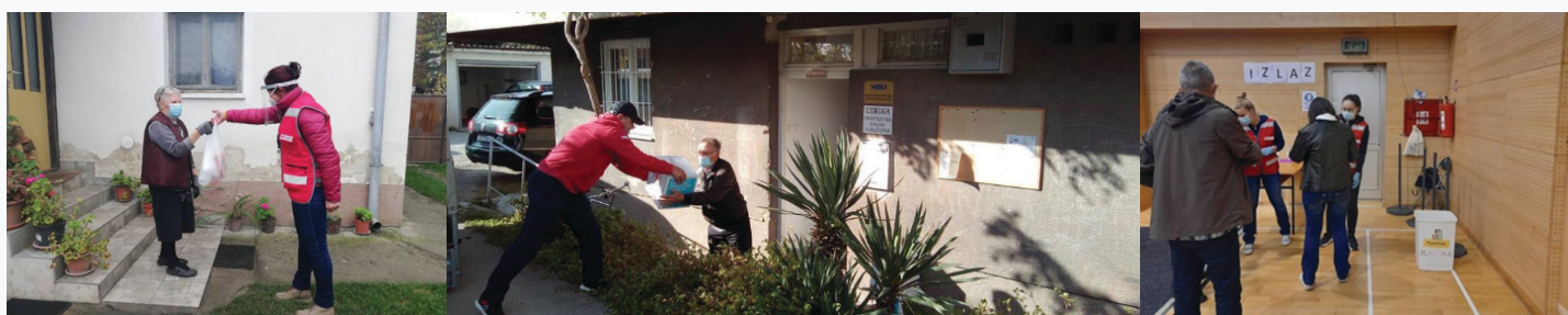
8-9. Kép balról jobbra: GDCK Varaždin Önkéntesek ellátási cikket szállítanak ki, Photo 10: GDCK Varaždin Önkéntesek az oltóponton

Varaždin (Varasd) Város Vöröskeresztje (GDCK Varaždin) szintén valósított meg a pandémia kihívásaira irányuló projekteket. A “Segítségnyújtás szociálisan veszélyeztetett háztartások számára a COVID-19 pandémia idején Horvátországban” című projekt eredményeként 648 élelmiszercsomagot juttattak el 614 családhoz (veszélyeztetett csoportokhoz tartozó családtagokkal) Varaždin megyében, beleértve Cesticát is. 2020 májusában további 600 (veszélyeztetett csoportokhoz tartozó) háztartás jutott napi háromszor meleg ételhez a “Napi meleg étel kiszállítás szociálisan vagy egészségügyileg hátrányos helyzetű időseknek” című pilot program keretében. A világjárvány későbbi szakaszaiban (2021) a Vöröskereszt és Cestica önkormányzata irányításával önkéntesek segítették a lakosság beoltását a pandémia megfékezése érdekében.