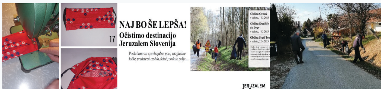
16-17. Kép (balról jobbra): Az ormoži önkéntesek által készített maszk, a „Megtisztítjuk Jeruzalemet” elnevezésű önkéntes akció plakátja, és egy fotó a 2021-es eseményről

Ezen túlmenően a közösségben zajló önkéntes akciókat (a világjárvány előtt szervezett éves akciókat) is hozzá kellett igazítani az “új normálisához”. Sokak számára a pandémia súlyos, nehezen elviselhető terhet jelentett, és könnyű lett volna egyszerűen lemondani ezeket az akciókat/rendezvényeket és várni a jobb időkre. Ormožban világossá vált, hogy intézkedéseket kell hozni annak érdekében, hogy a korábbi események, ha más formában is, de folytatódhassanak. A bevezetett változtatások között szerepelt az egészségügyi és biztonsági intézkedések alkalmazása az akciók során, a közeli érintkezés elkerülése más önkéntesekkel, szabadtéri tevékenységek ösztönzése stb. Hasonló változtatásokat alkalmaztak az “ OČISTIMO DESTINACIJO JERUZALEM SLOVENIJA 2021/Megtisztítjuk Jeruzalemet (Szlovénia) 2021 ” elnevezésű önkéntes akció során is. Ez az évente megrendezett esemény összehozza Ormož polgárait, akik összegyűjtik a szemetet az utak mellől és a közeli erdőkből. Azzal, hogy a polgárok a kezükbe vették a kezdeményezést és bevezették a szükséges változtatásokat, az esemény a tervek szerint le tudott zajlani 2021-ben is; így hozzájárult a környezetvédelmi tevékenység fejlesztéséhez a településen.