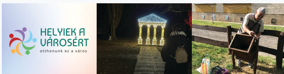
31-33. Kép: Helyiek a Városért Egyesület. A logó és az önkéntesek munkája az adventi fesztiválon. Az utolsó képen a jobb oldalon egy önkéntes látható egy városi szemetes karbantartása közben.

A közintézmények által megtett lépéseken túl Sásd város polgárai is összefogtak (a Helyiek a Városért Egyesületen keresztül) és saját kezdeményezésekkel biztosították, hogy a város ellenálló maradjon ezekben a nehéz időkben is. Kisléptékű akciók voltak ugyan, de a város lakóinak nagyon sokat jelentettek és segítettek enyhíteni a terhet, amit a pandémia okozott a polgároknak. A polgárok rendszeresen önkénteskedtek (csapatokban) és játszótereket tisztítottak meg (megjavították és lefestették a játékokat, összeszedték a szemetet stb.), ünnepekhez és évszakokhoz kapcsolódó városi dekorációt helyeztek ki, virágot ültettek a városban, adventi vásárt szerveztek stb. A legkisebb segítség is sokat számított. Ezek az akciók hozzájárultak a közösségi identitás felépítéséhez és fenntartásához. Ilyen módon bevonva a lakosságot a munkába, a közösség túljutott a pandémia legrosszabb pillanatain is. Az aktív polgári szerepvállalás, a csapatmunka és az alkalmazkodókészség a folyton változó körülményekhez a világvárvány idején a legjobb eredményeket és kimeneteket biztosította a polgárok számára.