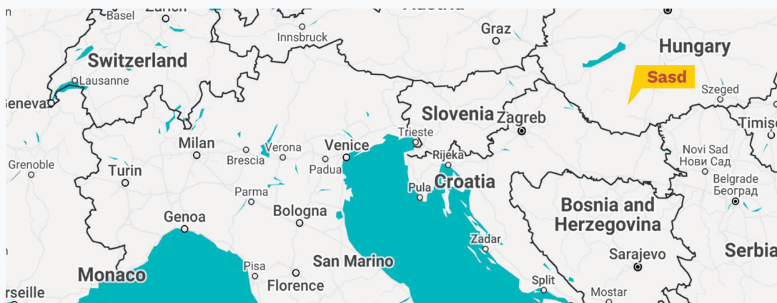
6:Térkép Sásd, Magyarország

Sásd városa mintegy 32 km-re fekszik Pécs és Kaposvár városától. Alakossága 2 900 fő és Magyarországon (különösen Baranyában) jelentős mezőgazdasági, kereskedelmi és közlekedési központként ismert. Sok más kivároshoz hasonlóan Sásd is büszke az összetartó közösségére, melyben a polgárok támaszkodhatnak egymásra a fejlődés vagy a nehézségek leküzdése érdekében.