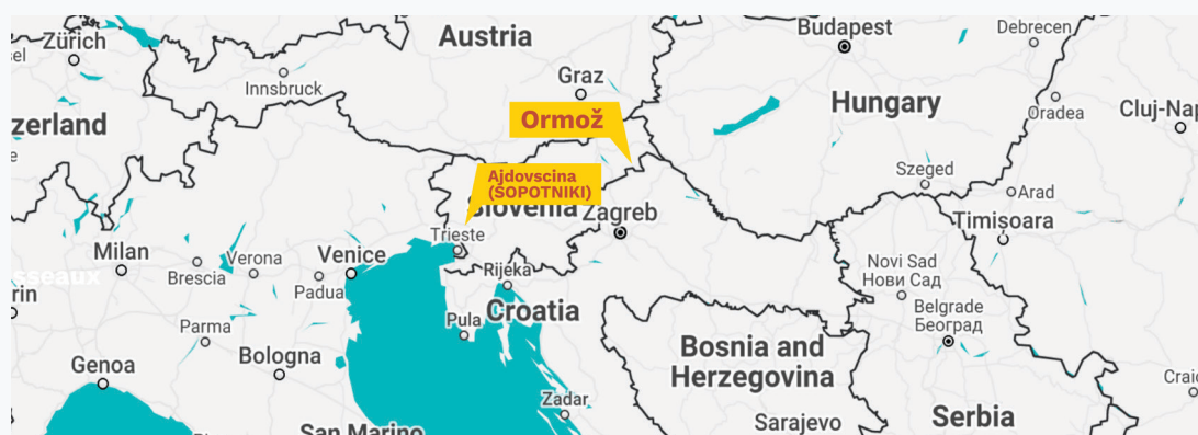
3. Térkép: Ormož és Ajdovščina elhelyezkedése