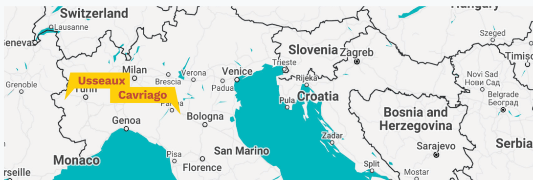
4.Térkép Cavriago és Usseaux, Olaszország

A BEYOND projektben két vidéki közösség vesz részt Olaszországból: Cavriago település az Emilia-Romagna régióból és Usseaux település a Piemonte régióból. Bár mindkét település vidéki jellegű és szembesülnek hasonló kihívásokkal (pl. a lakosság hozzáféréseinek biztosítása a közszolgáltatásokhoz), népesség és földrajzi adottságok szempontjából nagyon eltérőek. Ez azt is jelenti, hogy a COVID-19 pandémiára adott válaszaik is különbözőek voltak a lakosok kihívásainak kezelése érdekében.