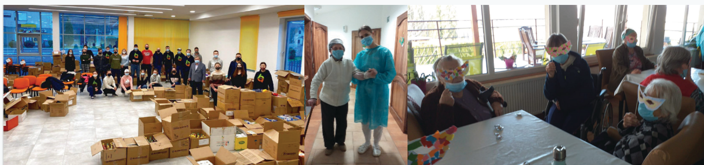
1-3. Fotó Balról jobbra - 1. fotó: A “Hiperaktivni” Egyesület fiatal önkéntesei élelmiszert és ellátási cikkeket gyűjtenek rászoruló családoknak a világgjárvány idején; 2-3. fotó: A Novi život Idősek Otthona a lakók napi szükségleteiről gondoskodik a pandémia tetőzése idején és az időotthon lakói mindent megtesznek a járványon való túllépésre álarcos ünnepléssel

Az önkormányzat által vezetett egyik projekt, ami nagyban hozzájárult az idősek és a fogyatékkal élők szükségleteinek kielégítéséhez, az ESZA által társfinanszírozott “Zaželi: Foglalkoztatási program nőknek Cestica városában” volt, ami tulajdonképpen a pandémia előtt kezdődött. A projekt két, a közösséget érintő problémára fókuszált. Az egyik, hogy az időseknek és fogyatékkal élőknek személyes segítségre volt szüksége ahhoz, hogy beilleszkedjenek a közösségbe és méltósággal élhessenek. Másrészt a projekt a munkanélküli nőkre koncentrált a közösségben, akiknek a szakmájukban nem volt lehetőségük elhelyezkedni. A projektet a COVID-19 valóságához igazítva hat nőt helyeztek el és képezték át otthoni segítőnek fogyatékkal élők mellé. Így 24 idős, fogyatékkal élő embernek nyújtottak támogatást, akik személyes segítségre szorultak. Ez a segítség kiterjedt a gyógyszervásárlásra, főzésre, takarításra, számlák kifizetésére, öltöztetésre stb.