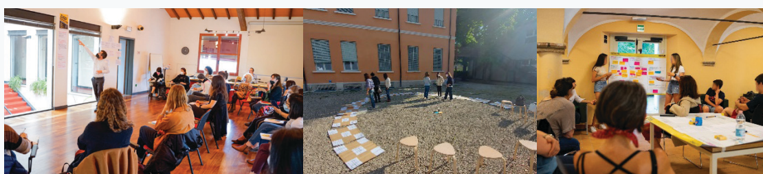
20-23. Kép (“DAD Generation” projekt: balról jobbra – a projektindító, szabadtéri workshop és a hackathon.