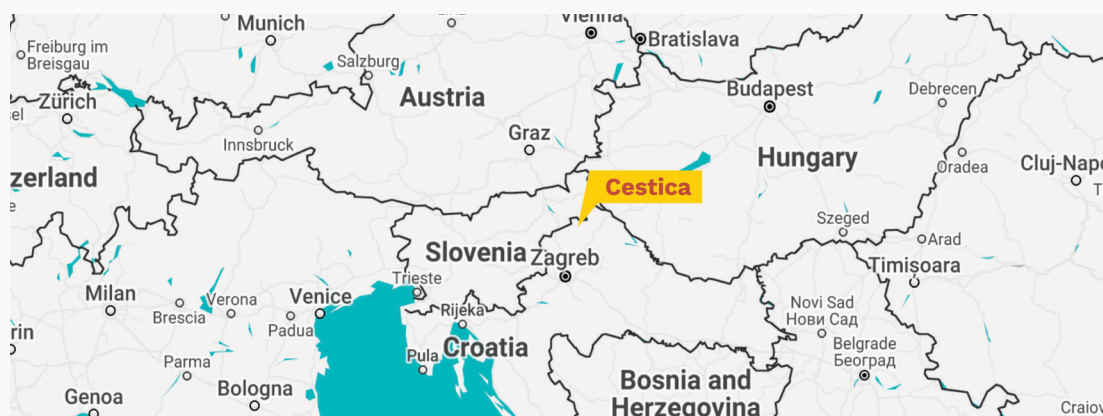
2. Térkép: Cestica elhelyezkedése

Cestica község egy 5500 fős kis közösség a Zagorjei dombvidéken, a horvátországi Varaždin (Varasd) megyében, a szlovén határ mentén. A település friss termékeiről, helyben termelt boráról és dombos tájairól ismert. Mint sok más vidéki közösség, Cestica is a kapcsolataira (a közösség tagjai között, illetve más településekkel és közszolgáltatókkal) támaszkodik, hogy fenntartsa a lakosság életszínvonalát. Ilyen kapcsolatok nélkül a kisvárosok, mint Cestica ki vannak téve a gazdasági és társadalmi megrekedés veszélyének.