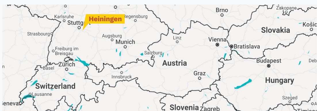
5. Térkép Heiningen, Németország

Heiningen települése egy sokszínű és élénk közösség, amely Baden-Württembergben, Göppingen körzetében található. Heiningen körülbelül 5200 lakost számlál, és buja erdők és festői folyók közelében fekszik. A közösségen belül a lakosok több, mint 25%-a 65 év feletti, és vannak még olyan veszélyeztetett helyzetben lévők (migránsok, fogyatékkal élők stb.), akiknek segítségre és támogatásra van szükségük. E körülmények miatt az önkormányzat számára prioritást jelentett egy olyan környezet megteremtése, ahol mindenki úgy érzi, szívesen látják és megbecsülik.