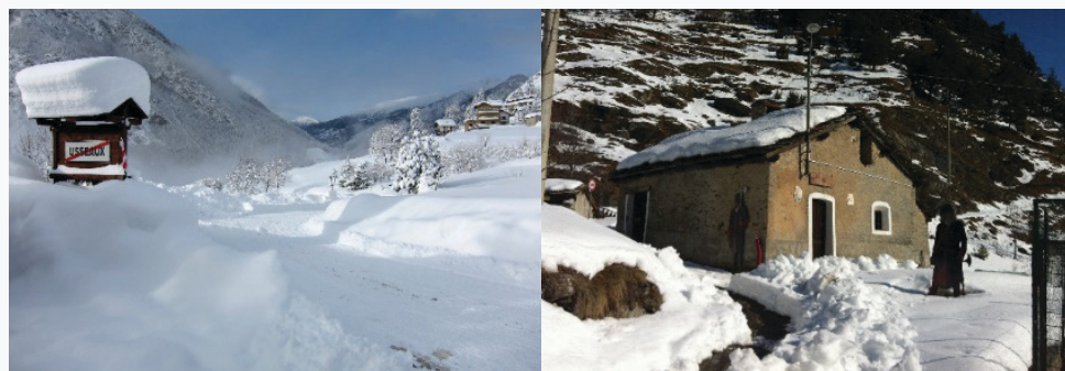
26-27. Kép: Usseaux télen. Amikor világvilágjáró 2020. márciusában lecsapott, Usseaux-t nagyon nehéz volt megközelíteni az időjárási körülmények miatt. A „Mansia” segítségével Usseaux le tudta küzdeni a pandémia legsúlyosabb hatásait is.

Usseaux világvilágjárásra adott válasza megmutatta, hogy az önkéntesség és a közösség együttműködése segítségével a polgárok a komoly válsághelyzeteket is le tudják küzdeni. Usseaux rájött, hogy a világvilágjáróhoz hasonló időszakokban nagyon fontos a polgárokkal való szoros kapcsolat a lakosok egészségének és biztonságának megóvása érdekében. Ilyen lépések megtételével a válsághelyzetben a polgárok közti kapcsolat megerősödik, a közösség erősebb lesz, mint valaha, hajlandó és képes lesz szembenézni az új kihívásokkal a jövőben.