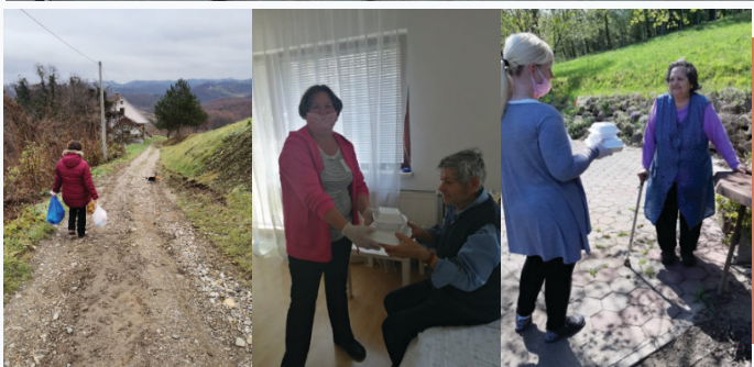
5-7 Kép. A fogyatékkal élők otthoni segítői A Zaželi című ESZA projekt keretében élelmiszert és ellátási cikkeket szállítanak ki Cestica távoli részein élő lakosoknak