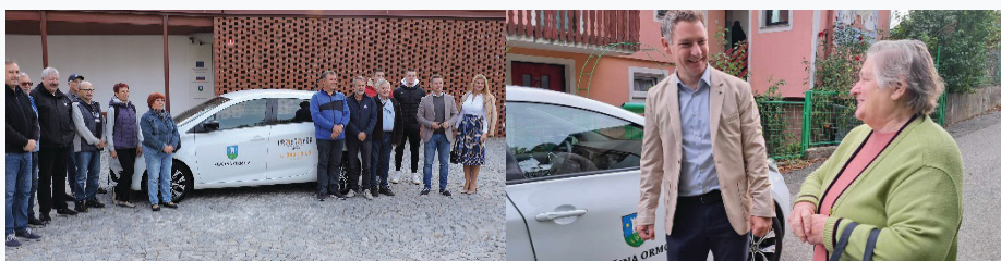
18-19. Kép (balról jobbra): A PROSTOFER programban részt vevő önkéntes sofőrök Ormožon és Danijel Vrbnjak polgármester a szolgáltatást igénybe vevőkkel

Rászorulók alatt azokra gondolunk, akik egyedül nem tudják megoldani az alapvető feladatokat, akik fogyatékkal élnek vagy nem tudnak egyedül vezetni. Sokuknak nincsenek rokonai, alacsony a havi jövedelmük és nehezen férnek hozzá a tömegközlekedéshez. Az ingyenes személyszállítást biztosító önkéntesek lehetővé teszik a számukra, hogy eljussanak az orvoshoz, gyógyszertárba vagy bevásárolni. Ormož településen 16 önkéntes sofőrrel működik a szolgáltatás, akik mindig készek segíteni. 2023-ban 122 szállítást végeztek. A projekt megvalósításával Ormož hozzájárult, hogy minden lakosa méltó körülmények között élhessen. Végül Ormož nagyon sokat tett azért, hogy az önkéntesek munkáját elismerjék és máshol is kövessék a példájukat. 2024-ben Ormož elnyerte az "Önkéntesbarát önkormányzat" címet, amit Slovenska mreža prostovoljnih organizacij/Szlovéniai önkéntes szervezetek hálózata ítelt oda.